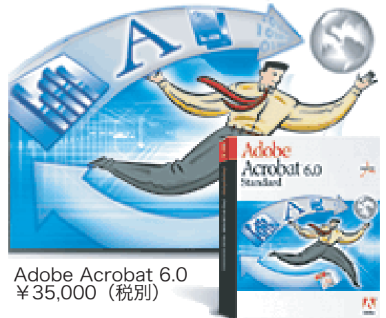
Adobe Acrobat 6.0 ¥35,000 (税別)

どんなアプリケーションから作成した電子文書でも、紙の書類でも、あるいはWebサイトでも、Adobe PDF (Portable Document Format) ファイルに簡単に変換でき、安全かつ確実に文書のやり取り、回覧・レビュー (文書チェック・注釈) を行うことができます。